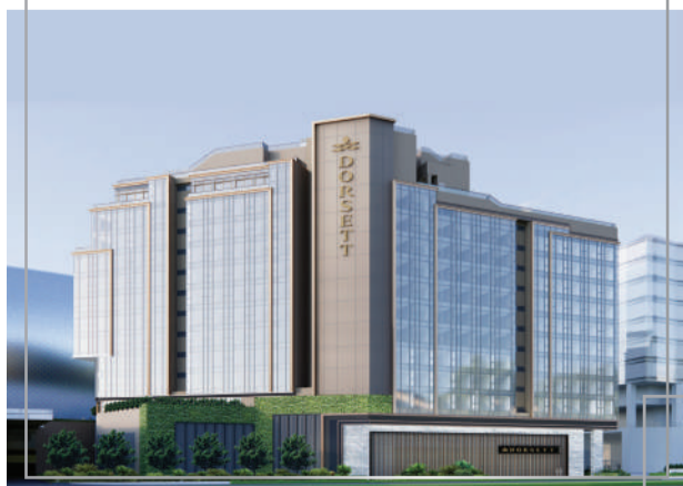
新九龍內地段第6607號承啟道酒店及商業發展項目