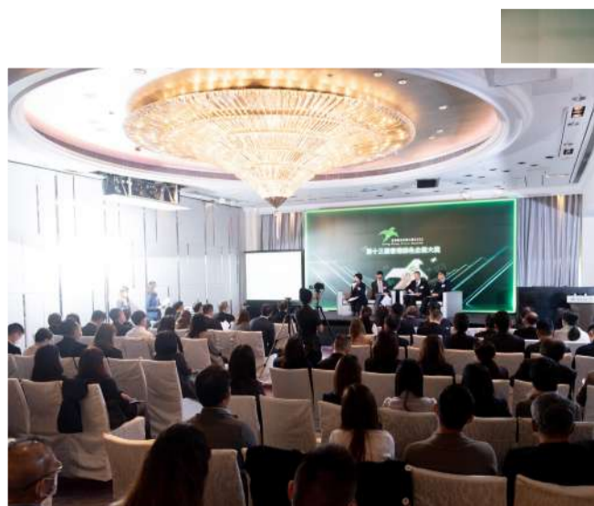
香港綠色企業大獎籌備及評審委員分享今屆參獎機構表現

《香港氣候行動藍圖2050》包含4大減碳策略及措施，包括「淨零發電」，即2035年或之前不再使用煤作日常發電，增加可再生能源在發電燃料組合中的比例至7.5%至10%，往後提升至15%；「節能綠建」是通過推廣綠色建築等減少建築物的整體用電量。目標是在2050年或之前，商業樓宇用電量較2015年減少3至4成，以及住宅樓宇用電量減少2至3成；「綠色運輸」是通過推動車輛和渡輪電動化，長遠達至2050年前車輛零排放和運輸界別零碳排放的目標；「全民減廢」是加強推動減廢回收，預計在2023年落實垃圾收費及2025年起分階段管制即棄塑膠餐具。