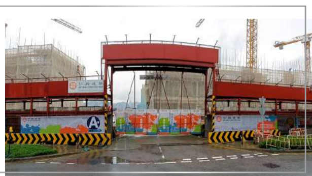
啟德承豐道18號住宅發展項目