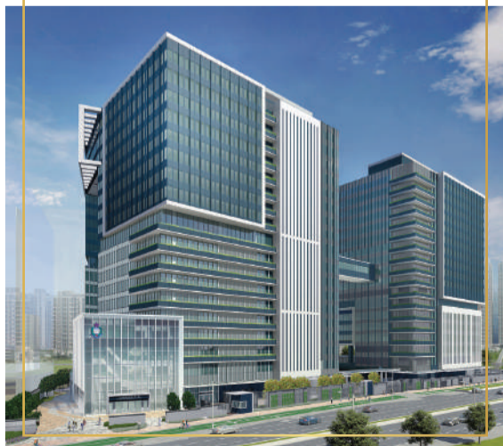
將軍澳入境事務處總部